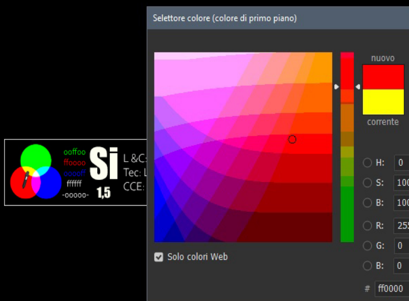
Fig. 3: interfaccia del selettore di colore che permette la verifica cromatica

All'estrema sinistra troviamo innanzitutto un punto di riferimento cromatico per permettere al fruitore di verificare quanto l'immagine che vede è fedele all'immagine originaria. E' chiaro infatti che, seppure la percezione non è mai completamente riproducibile, è anche vero che si può ridurre le differenze insorte nei vari procedimenti di salvataggio attraverso logaritmi diversi di diversi software ed applicazioni. I tre cerchi su sfondo nero primario di colori primari RGB che si sovrappongono additivamente formando 4 colori derivati permetterà una verifica dei codici esadecimali posti subito a destra: si usi in Photoshop (PS), Gimp, Artweaver la funzione Selettore colore o simili per constatare se i valori prelevati corrispondono a quelli indicati. In particolare, la precisione in PS aumenta se si biffa la casella "Solo colori Web". In altri programmi e/o con casella non biffata è tollerato uno scostamento di un valore successivo per i valori numerici (da 0 a 1) e precedente e per le lettere (da f ad e). Per esempio, il rosso ha come valore ideale #ff0000 ma vengono considerati ugualmente adeguati i valori #fe0000, #ff0001, fe0001, fe0010 etc..