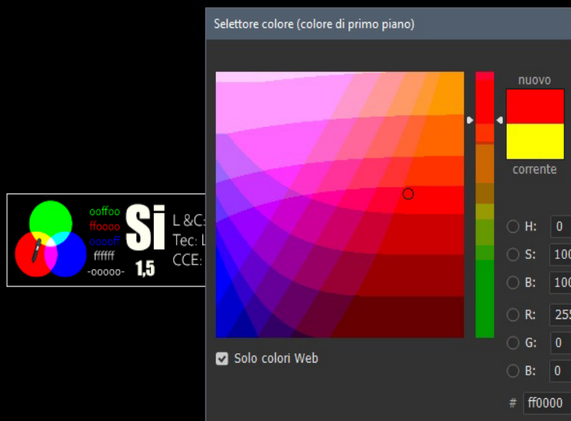
Fig. 3: interfaccia del selettore di colore che permette la verifica cromatica

All'estrema sinistra troviamo innanzitutto un punto di riferimento cromatico per permettere al fruitore di verificare quanto l'immagine che vede è fedele all'immagine originaria. E' chiaro infatti che, seppure la percezione non è mai completamente riproducibile, è anche vero che si può ridurre le differenze insorte nei vari procedimenti di salvataggio attraverso logaritmi diversi di diversi software ed applicazioni. I tre cerchi su sfondo nero primario di colori primari RGB che si sovrappongono additivamente formando 4 colori derivati permetterà una verifica dei codici esadecimali posti subito a destra: si usi in Photoshop (PS), Gimp, Artweaver la funzione Selettore colore o simili per constatare se i valori prelevati corrispondono a quelli indicati. In particolare, la precisione in PS aumenta se si biffa la casella "Solo colori Web". In altri programmi e/o con casella non biffata è tollerato uno scostamento di un valore successivo per i valori numerici (da 0 a 1) e precedente e per le lettere (da f ad e). Per esempio, il rosso ha come valore ideale #ff0000 ma vengono considerati ugualmente adeguati i valori #fe0000, #ff0001, fe0001, fe0010 etc..