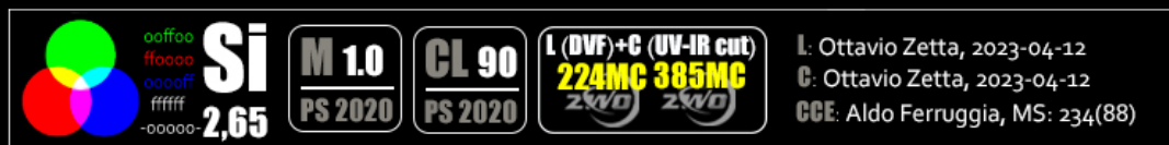
Fig. 2: la barra delle informazioni selenocromatiche, IB; la sezione sino all'acronimo 'Si' ed al sottostante Selenochromatic Score è quella obbligatoria. La restante parte può presentare dati in contrassegni e/o testo

L'immagine selenocromatica viene corredata di una serie di informazioni. Alcune ricalcano i dati di accompagnamento alle normali immagini astronomiche, altre sono propriamente selenocromatiche. Tali informazioni sono condensate in una Info-Bar (IB) alta almeno 100 pixels: