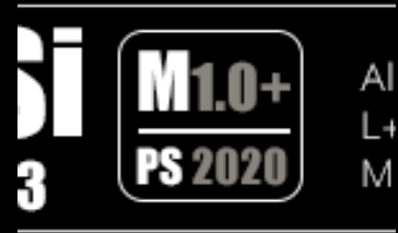
Fig. 4: Contrassegno in IB della macro utilizzata. Nello specifico significa: applicata la versione della macro 1.0 con aggiunta della funzione di Colore Lab; macro creata con Photoshop versione 2020

A destra della colonna dei codici esadecimali si trovano le lettere Si (acronimo di Selenochromatic Image in font 'Impact') che indicano che i valori di Mineral Score ottenuti certificano che si tratta d'immagine selenocromatica; subito al di sotto il numero dello Selenochromatic Score sta ad indicare l'attendibilità: esso è ottenuto dividendo il Mineral Score col numero dei reperi considerati. L'immagine è tanto più attendibile quanto più vicino a 3 è questo numero e tanto meno attendibile quanto è più vicino a 0. L'immagine non è sufficientemente attendibile per un valore uguale o sotto a 2. Il suo calcolo è in capo all'autore della CCE che appone l'IB come sugello della elaborazione selenocromatica. Tale parte può essere utilizzata per semplicità anche da sola. A destra del Selenochromatic Score è possibile trovare il contrassegno di una Macro e quello dell'eventuale utilizzo dell'unica procedura di esaltazione cromatica consentita dopo la sua applicazione: Color Lab (talora rappresentato con un '+') col relativo valore di esaltazione (vedi Folia V). Nella restante parte troviamo testo e/o contrassegni: