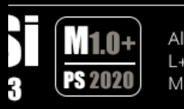
Fig. 4: Contrassegno in IB della macro utilizzata. Nello specifico significa: applicata la versione della macro 1.0 con aggiunta della funzione di Colore Lab; macro creata con Photoshop versione 2020

A destra della colonna dei codici esadecimali si trovano le lettere Si (acronimo di Selenochromatic Image in font 'Impact') che indicano che i valori di Mineral Score ottenuti certificano che si tratta d'immagine selenocromatica; subito al di sotto il numero dello Selenochromatic Score sta ad indicare l'attendibilità: esso è ottenuto dividendo il Mineral Score col numero dei reperi considerati. L'immagine è tanto più attendibile quanto più vicino a 3 è questo numero e tanto meno attendibile quanto è più vicino a 0. L'immagine non è sufficientemente attendibile per un valore uguale o sotto a 2. Il suo calcolo è in capo all'autore della CCE che appone l'IB come sugello della elaborazione selenocromatica. Tale parte può essere utilizzata per semplicità anche da sola. A destra del Selenochromatic Score è possibile trovare il contrassegno di una Macro e quello dell'eventuale utilizzo dell'unica procedura di esaltazione cromatica consentita dopo la sua l'applicazione: Color Lab (talora rappresentato con un '+') col relativo valore di esaltazione (vedi Folia V). Nella restante parte troviamo testo e/o contrassegni: