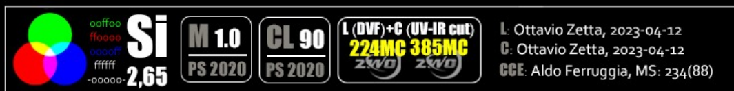
Fig. 2: la barra delle informazioni selenocromatiche, IB; la sezione sino all'acronimo 'Si' ed al sottostante Selenochromatic Score è quella obbligatoria. La restante parte può presentare dati in contrassegni e/o testo

L'immagine selenocromatica viene corredata di una serie di informazioni. Alcune ricalcano i dati di accompagnamento alle normali immagini astronomiche, altre sono propriamente selenocromatiche. Tali informazioni sono condensate in una Info-Bar (IB) alta almeno 100 pixels: